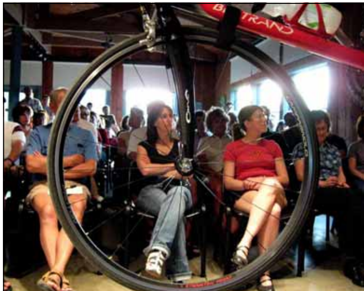
L'atelier Mécanique 1 a été très populaire avec 45 participants

Réseau vélo-boulot. Le Réseau vélo-boulot est une grande famille de cyclistes de la région de Gatineau qui choisissent de prendre leur vélo au moins une journée par semaine pour se