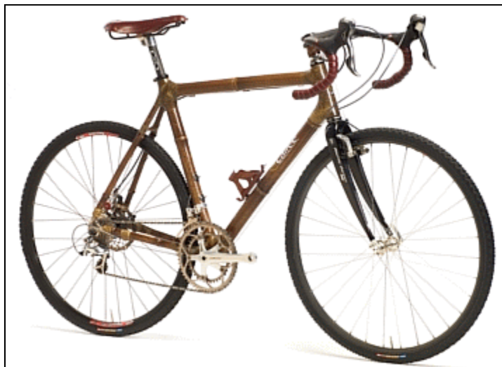
Vélo de bambou sur mesure 2 899 Euros. C'est pas cher pour se faire remarquer! Oh! Pardon, pour être écolo!

Je vous écris aujourd'hui afin de solliciter votre appui financier dans le cadre de la collecte de fonds qui sera entreprise en mai et juin 2008. La totalité des dons