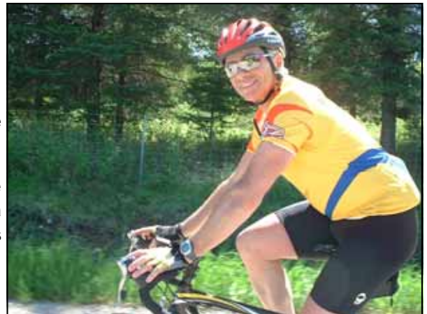
Ah! La Printanière, rien de plus beau...

Le départ du parcours long (140 km) se fera à partir de l'école St-Paul. De là, les cyclistes se