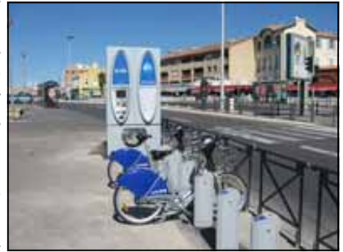
Marseille — Station en libre-service

service permet de louer un vélo en toute liberté, 7 jours sur 7, de 6 h à minuit. Pour rendre le vélo, le service est disponible 24 h / 24. On encourage les citoyens à avoir le réflexe vélo: «remplacer vos trajets en voiture par des trajets en vélo! Pas un gramme de carburant dépensé et zéro polluant émis... » Un site à voir: http://www.levelo-mpm.fr/