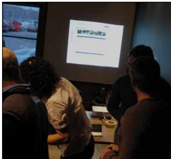
Présentation du site www.veloplaisirs.qc.ca

Voyage. « Je suis à la recherche d'un partenaire ou d'une partenaire pour faire du vélo à Toronto, Niagara Falls, Niagara on the Lake et les alentours. Une journée pour aller visiter le musée de Shania Twain à Timmins en Ontario. Les dates pour aller en vacances sont du 25 au 29 août.