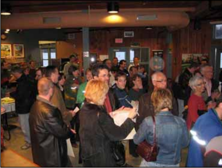
Il y avait foule à la Soirée d'inscription