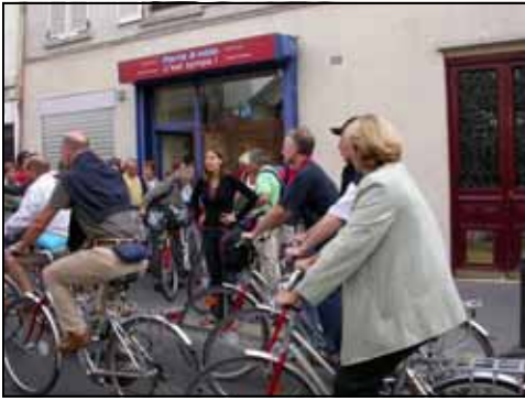
Paris à vélo

des tandems, la société Paris à vélo c'est sympa! offre un service de guides et d'accompagnateurs pour vous permettre de découvrir des lieux insoupçonnés et enchanteurs de Paris, en toute tranquillité et en toute sécurité. Paris et ses 5000 rues recèlent une multitude de quartiers calmes, de cités fleuries, d'ateliers d'artistes cachés au fond de cours et de monuments