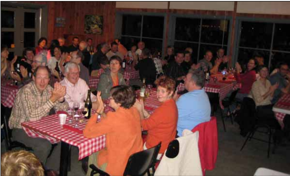
Soirée de clôture 2007

Coût du buffet 20 $/membre et 25 $/ non-membre (payable à l'entrée, argent comptant ou par chèque).