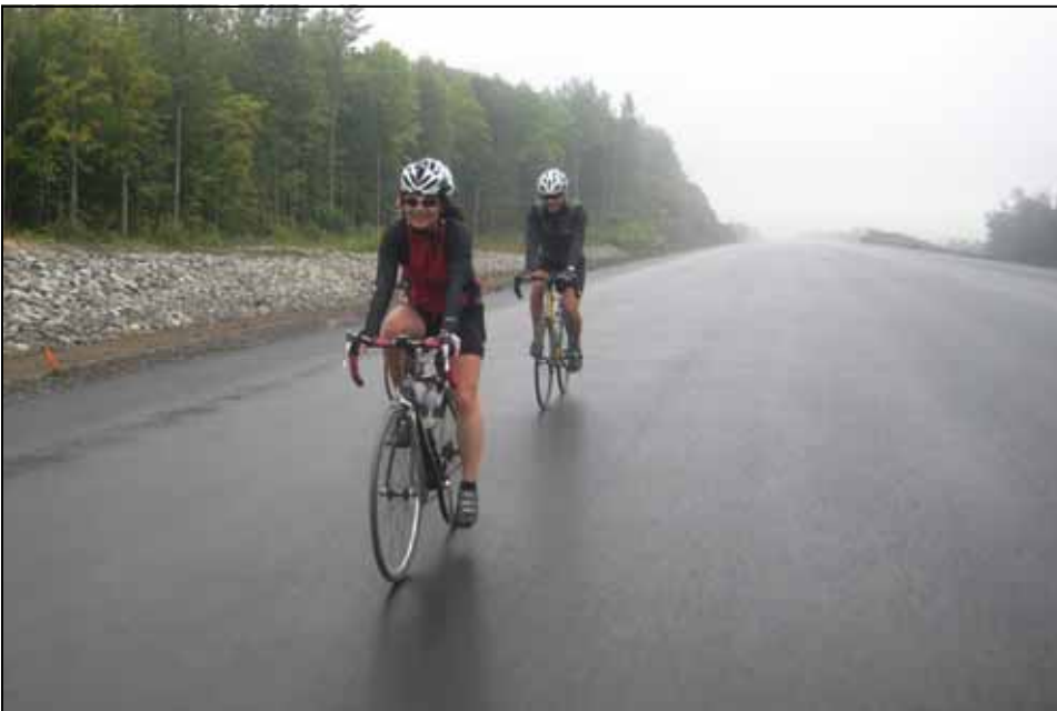
« Le club Vélo plaisirs termine la saison de son 20 e anniversaire en inaugurant l'autoroute 50 de Thurso à Buckingham ;-) »

CAP AIDS (Canada Africa Partnership on AID) et l'EUMC (Entraide universitaire mondiale du Canada) présentent « Pédaler pour CAP AIDS ». « Pédaler pour CAP AIDS » est une campagne annuelle qui a pour objectif de sensibiliser la population à propos de la pandémie du VIH/SIDA, tout en démontrant que nous pouvons faire une différence. La campagne de financement « Pédaler pour CAP AIDS » aide les travailleurs africains du VIH/SIDA en leur procurant un vélo pour leur travail. Pour chaque 200 $ amassé, CAP AIDS achètera un vélo pour un travailleur du VIH/ SIDA, ce qui leur donne la capacité de faire de la prévention, de donner des soins et d'augmenter les