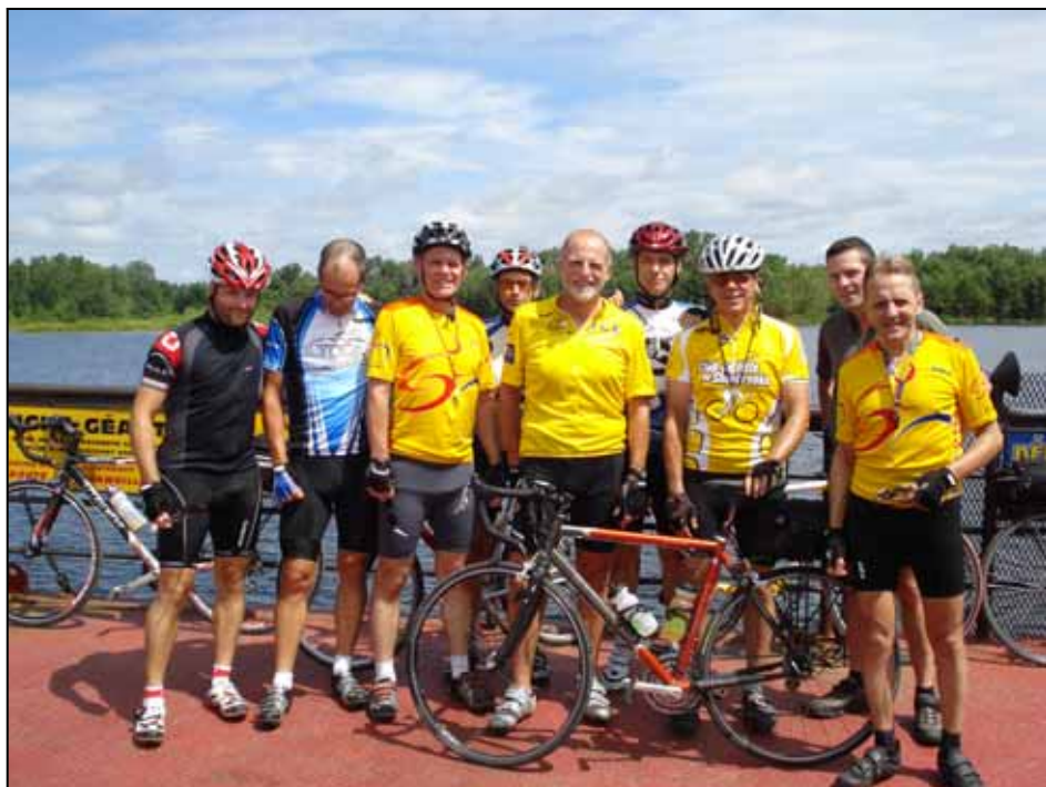
La Super Cabina du 25 juillet 2008 en croisière vers Quyon!

Prix de présence, rafraîchissement et collations. Pour s'inscrire, parrainer un participant ou faire un don, voir le www.capaid.org . Pour plus de renseignements, veuillez composer le 613-862-6072 ou écrire à capaid.ottawa@gmail.com