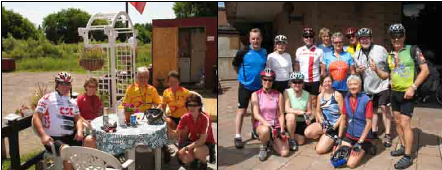
D'autres photos de l'Estivale 2009

Dans le cas d'une sortie en covoiturage, veuillez toujours vérifier avec le responsable de la sortie afin de savoir si elle a effectivement lieu. Le responsable d'une sortie en covoiturage peut décider d'annuler la sortie si un nombre insuffisant de participants a signalé son intérêt.