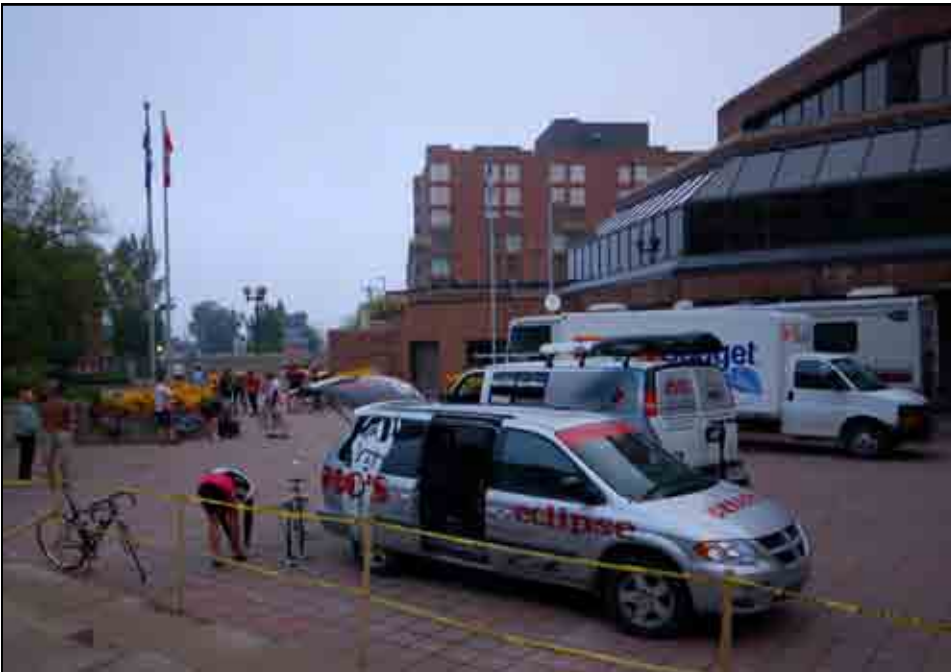
Départ — Automnale 2008

Pour ceux qui hésitent encore à faire cette randonnée, je vous encourage à vous inscrire à la prochaine édition du RLCT! Merci à toute l'organisation du RLCT et particulièrement à chaque personne qui rend cette randonnée possible, année après année!