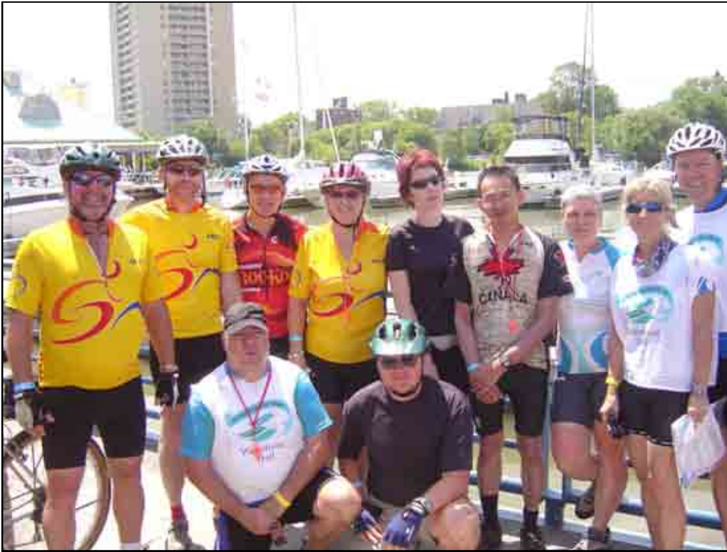
Participants de Vélo-plaisirs au Great Waterfront Trail Adventure 2009

n'était pas pour longtemps. Le paysage était magnifique. Les pauses étaient bien réparties sur le parcours. L'accueil était chaleureux! Il ne manquait rien. Nous étions traités comme des rois. Granola, noix, fruits, yogourt, salade de fruits, Gatorade, eau, café, jus, chips et j'en passe... À certains endroits, il fallait payer 1 $ ou 2 $ en fonction de ce que l'on choisissait. C'était pour encourager les communautés locales. Également, il y avait du yoga et des massages gratuits dans certaines haltes. C'était bien apprécié par les cyclistes. De temps en temps, on pouvait faire un peu de tourisme selon notre intérêt. Le déjeuner, le dîner et le souper étaient à nos frais entre 5 $ et 15 $. Les repas