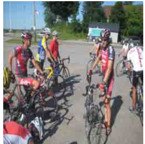
Quyong Portage-du-fort 2008