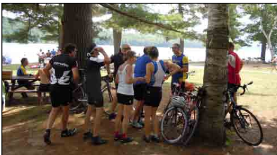
Pique-nique au lac Philippe le 17 juillet 2010.

Post-scriptum : Au plan législatif, la session parlementaire à Québec a pris fin sans que l'étude du projet de loi 71 ne soit complétée (Révision du Code de la sécurité routière du Québec). Il s'agissait de la troisième tentative du gouvernement du Québec pour faire adopter un article de loi qui rendrait le port du casque obligatoire. Le projet de loi 71 pourrait être remis à l'agenda en septembre. Un dossier à suivre.