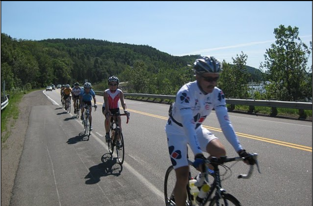
Randonnée dans les cols du fjord du Saguenay 2010.