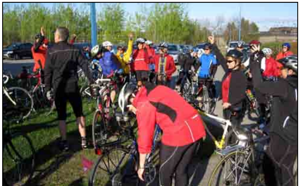
Atelier - Techniques de pédalage et de positionnement, le lundi 26 avril 2010

Tous les renseignements sur les activités de la Grande visite de Gatineau se retrouvent dans le dépliant d'information et sur notre site internet à l'adresse : www.grandevitedegatineau.com .