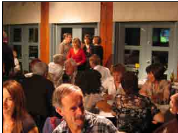
Soirée de clôture saison 2009

Bonnes randonnées automnales et au plaisir de vous rencontrer à l'assemblée annuelle et/ou au souper de clôture.